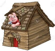
kuću od drva