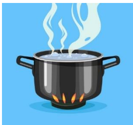
lonac kipuće vode