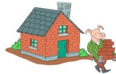
kuću od cigle