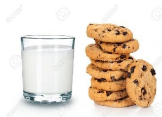
mlijeko i kekse