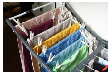
svježe oprana odjeća