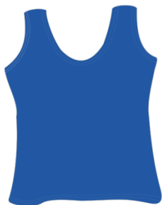
majica na bretele (majica na ručice)