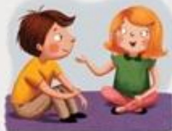
SLUŠAM KAD DRUGI GOVORE