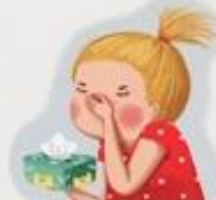
STAVLJAM RUKU KAD KIŠEM ILI KAŠLJEM