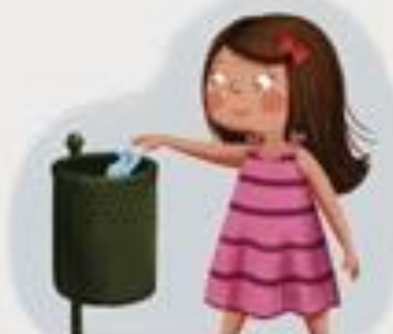
SMEĆE BACAM U KANTU