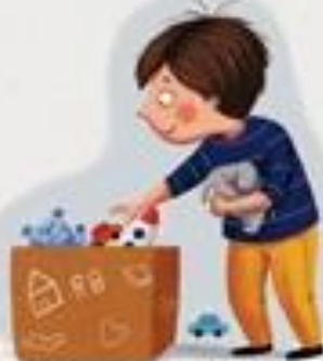
POSPREMAM SVOJE STVARI