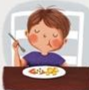
MIRNO SJEDIM ZA STOLOM I ŽVAČEM ZATVORENIH USTA