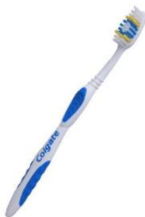
ČETKICA ZA ZUBE