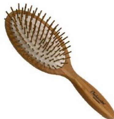
ČETKA ZA KOSU