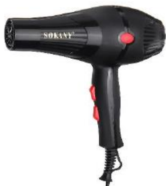
FEN ZA KOSU