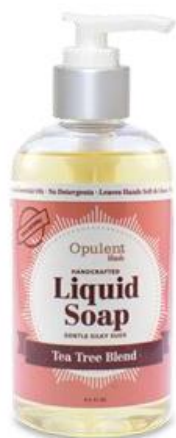
SAPUN ZA RUKE