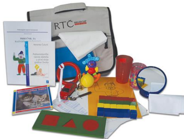
Razvojni test Čuturić (RTČ)

Razvojni test Čuturić (RTČ-M i RTČ-P) koristi se za utvrđivanje psihomotoričkog razvoja djeteta do 8. godine u području psihomotorike, okulomotorike, emocionalnosti, govora, slušno-motoričkih reakcija, komunikacije i društvenosti te verbalnog izražavanja znanja.