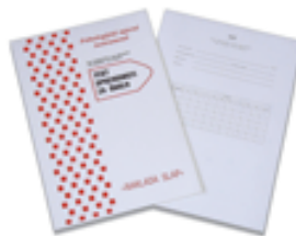
Test spremnosti za školu (TŠŠ)

Test spremnosti za školu- TŠŠ je namijenjen provjeri spremnosti za upis u 1. razred osnovne škole. Ispituju se sposobnosti i znanja koja su temelj za uspješno učenje na početku školovanja.