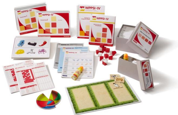
Wechslerova predškolska i primarna ljestvica inteligencije (WPP SI-IV)

Wechslerova predškolska i primarna ljestvica inteligencije (WPP SI-IV) je test inteligencije namijenjen djeci u dobi od 2 godine i 6 mjeseci do 7 godina i 7 mjeseci