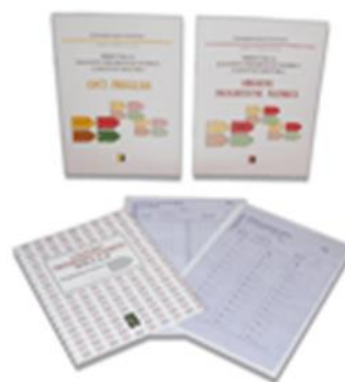
Progressivne matrice u boji ( CPM )

Progressivne matrice u boji (CPM) je naziv neverbalnog psihologijskog testa za procjenu opće inteligencije. Uspješno se koristi u radu s djecom od 5 do 11 godina, starijim osobama, osobama koje ne govore ili ne razumiju jezik, koje pate od tjelesnih oštećenja, afazije ili cerebralne paralize, s gluhim osobama, te s osobama s intelektualnim deficitom.