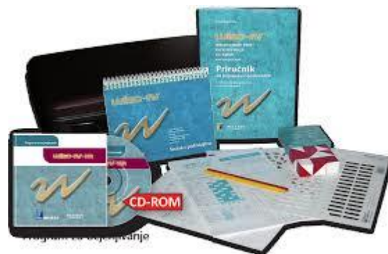
Wechslerov test inteligencije za djecu WISC-IV-HR

Wechslerov test inteligencije za djecu WISC-IV-HR najpoznatiji je test za mjerenje opće inteligencije i specifičnih kognitivnih sposobnosti kod djece u dobi od 6 godina do 16 godina i 11 mjeseci.